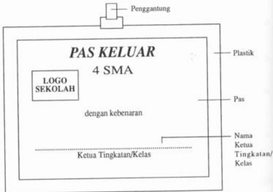
Pengetua/Guru Besar dan Semua Guru (2 keping)