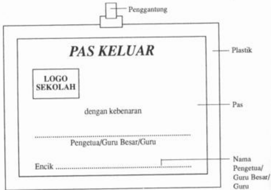
Pengetua/Guru Besar dan Semua Guru (2 keping)